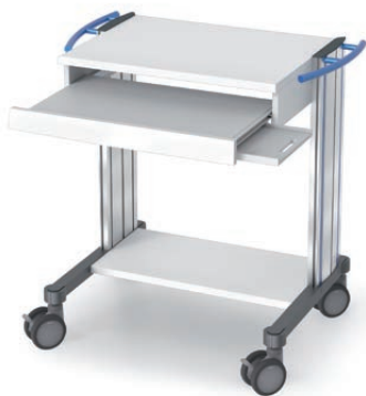
swingo® 60 in Holz-/Kunststoff Computerwagen