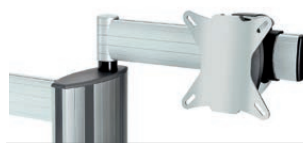
„alegro“ Monitorhalter auf Schwenkarm