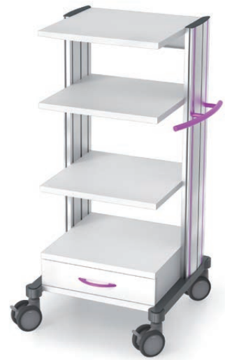
swingo®-clinic 45 in Metall Gerätewagen