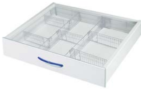
Schublade + Einsatz variabel