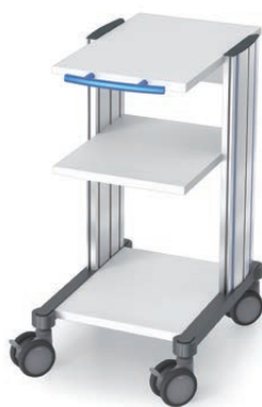
swingo® 45 in Holz-/Kunststoff Sonografiewagen