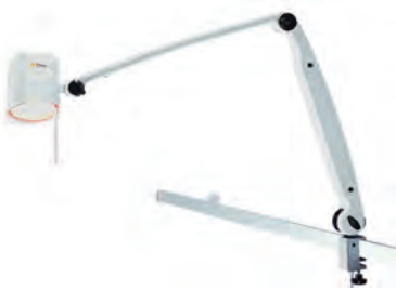
Gegenspiegelleuchte „Halux“ 35 F