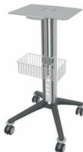
bravo - Gerätewagen 2