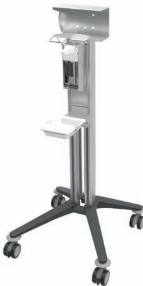
bravo - Hygienewagen 2