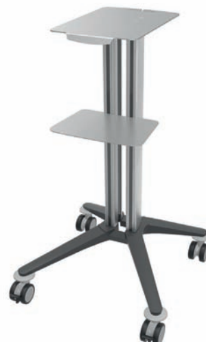
bravo - Basiswagen 3