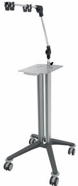
bravo - Ergometriewagen 1