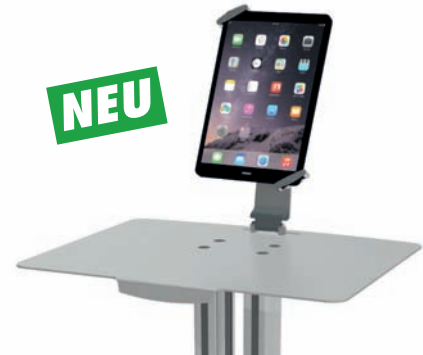
Ablageplatte mit Tablet-Halter