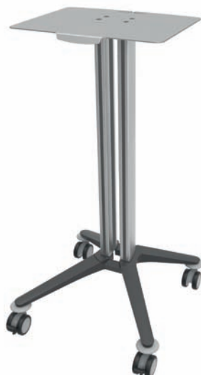
bravo - Basiswagen 6