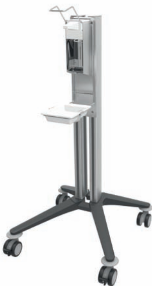
bravo - Hygienewagen 1