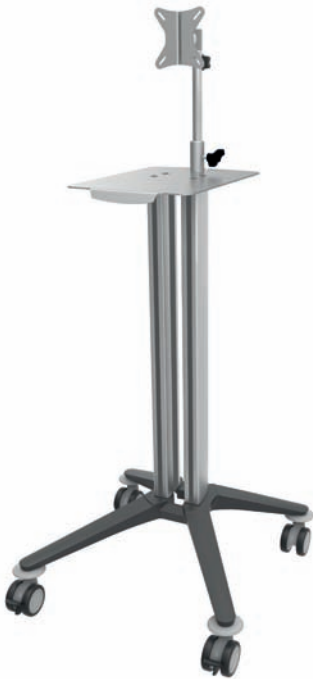
bravo - Computerwagen 1