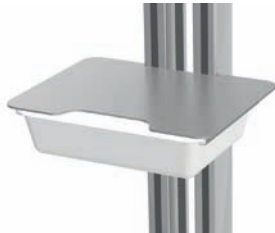
Ablageplatte mit Kunststoffschale