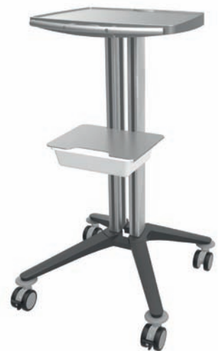
bravo - Dentalwagen 1