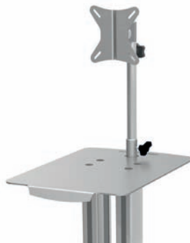
Ablageplatte mit TFT-Halter