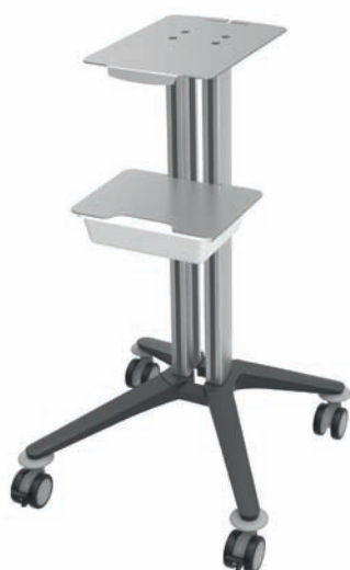
bravo - Basiswagen 5