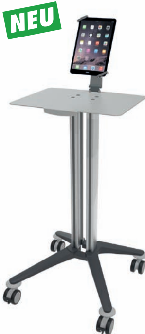
bravo - Tabletwagen 3