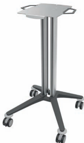
bravo - Basiswagen 2