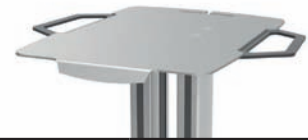
Ablageplatte mit Schiebegriffen