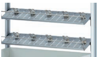
Organisationssystem mit 2 geneigten Ablageebenen aus Edelstahl