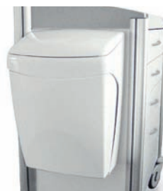
Abfallsammler „tango“ Inhalt 8 L mit Knieöffnungsmechanik