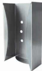
Halter für Spenderboxen aus Edelstahl für 1 Box