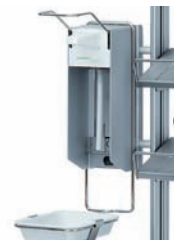
Seifen- und Desinfektions- mittelspender, Inhalt 1 L