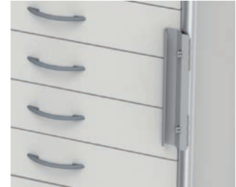
Verplombung für 3 Raster