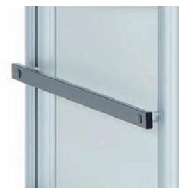
Normprofiltschiene aus Chromnickelstahl seitlich am keo®