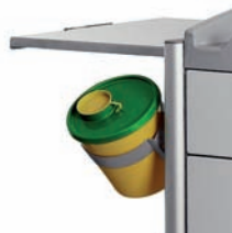
Entsorgungsbox „Medi-Müll“ Set mit 20 Boxen (1,5 L) und Halterung