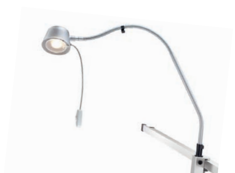
Culta LED S