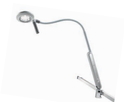
Visiano LED S