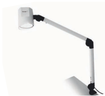
Halux® LED F 7-P