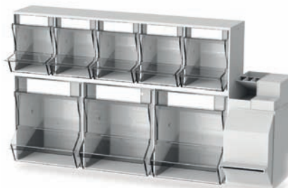
Injektionsset PicBox® Plus