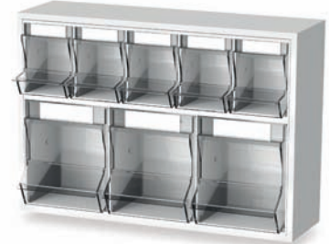
Injektionsset PicBox® multi