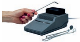
Spiegelerwärmer „Mirrotherm® Plus“