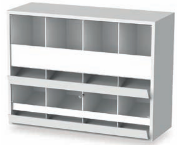
COMPACT Injektionsset mit 4 Spritzenfächern