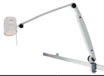
Halux 35F HNO Gegenspiegelleuchte