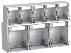
Injektionsset „PicBox®“ Wandmodell